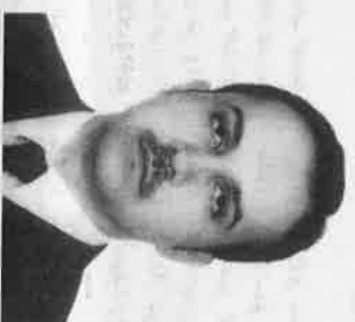
○ شيب داداباي.

الوحدات السكنية تم بيعها منذ طرح المشروع في العام الماضي.