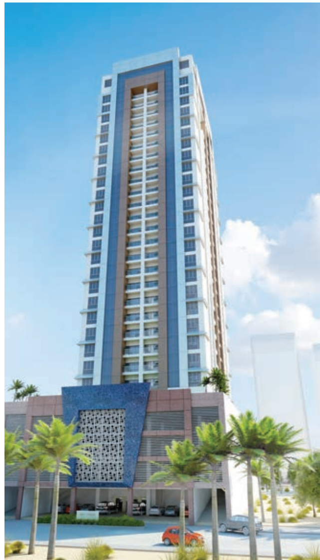
مشروع تيراسس السكني.

العقاري في الشركة بزيويد العملاء بكافة المعلومات المطلوبة عن المشروع. كما يتم خلال العرض تقديم عروض خاصة لمشروع سيف تيراسس ومشروع الجفير هايتس الذي تنفذه الشركة خلال شهر رمضان المبارك وفترة العيد.