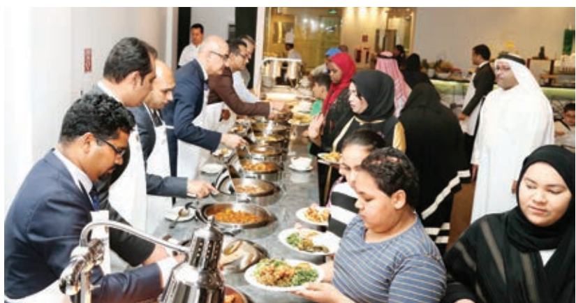
مسؤولي الفندق يرحبون بأطفال جمعية السنابل لرعاية الأيتام.

وكانت الشركة قد طرحت المشروع في مايو الماضي